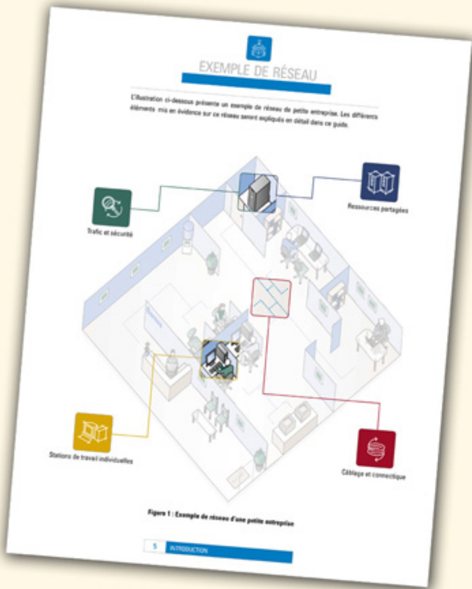
Product brochure for Dell, 48pp, FR, DE, ES