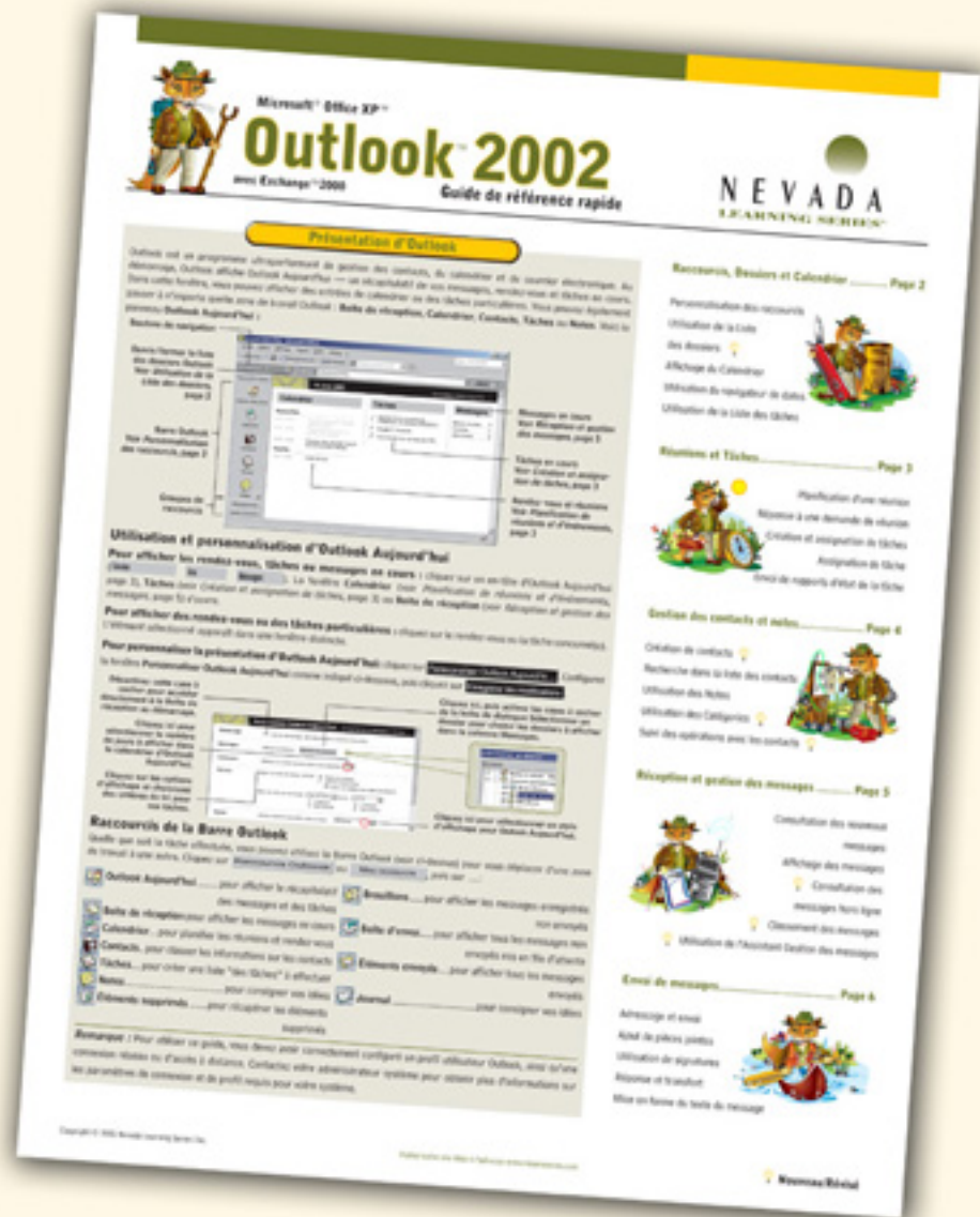
Product Brochures for DISC and Nevada, 48pp, PL, FR, DE, ES, IT